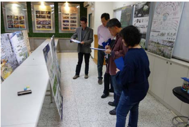
最後獲獎名單與名次討論